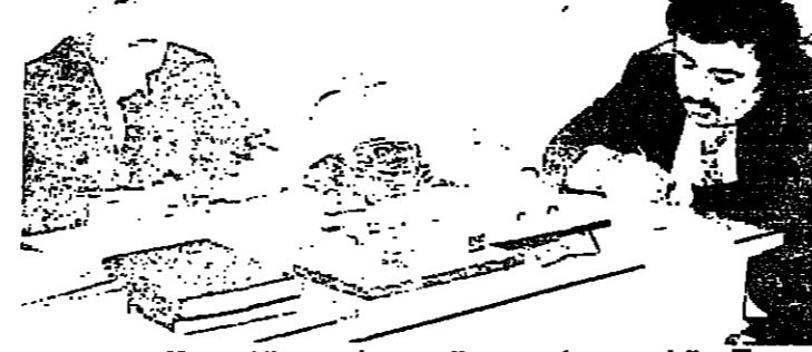
الرئيس عسيران يتحدث للصحفيين في مقره في بيروت

واضاف : اما الدولة ، فيلزم من ولائحاج الذي عقدناه في البيروتية المارونية بحضور السادة الاسكفة وحصولنا على قرارات ومواقف ايجابية ، فان النتيجة كانت استمرارية الوضع المؤسف هناك من غير ان يكون